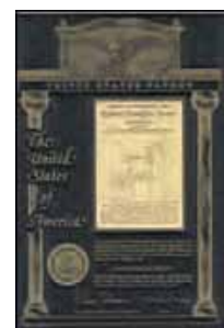
Brevetto U.S.A No. 5,973,595