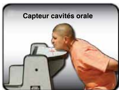
Capteur cavités orale

Il permet d'éviter la dissimulation d'objets métalliques dangereux, tels que ceux dans l'image, et rend plus sûr le lieu de détention.