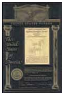
Brevet U.S.A. N° 5,973,595