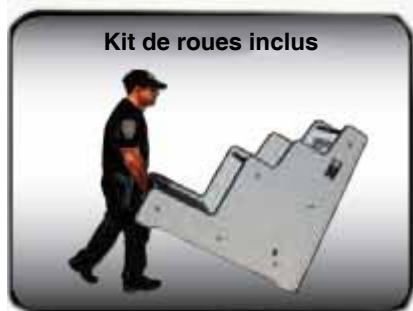
Kit de roues inclus