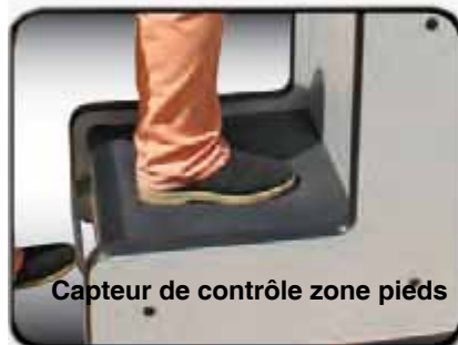
Capteur de contrôle zone pieds